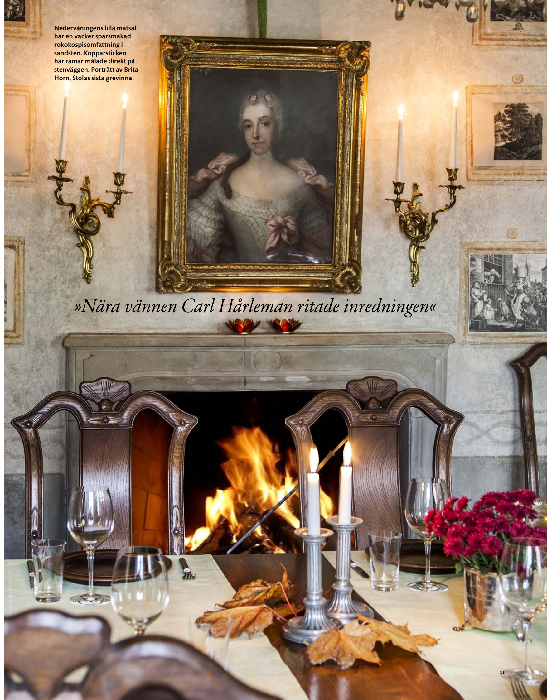
»Nära vännen Carl Hårleman ritade inredningen«