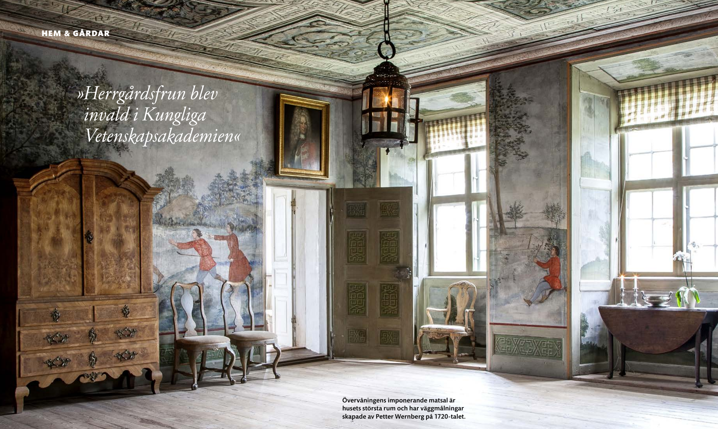
Övervåningens imponerande matsal är husets största rum och har väggmålningar skapade av Petter Wernberg på 1720-talet.

»Herrgårdsfrun blev invald i Kungliga Vetenskapsakademien«