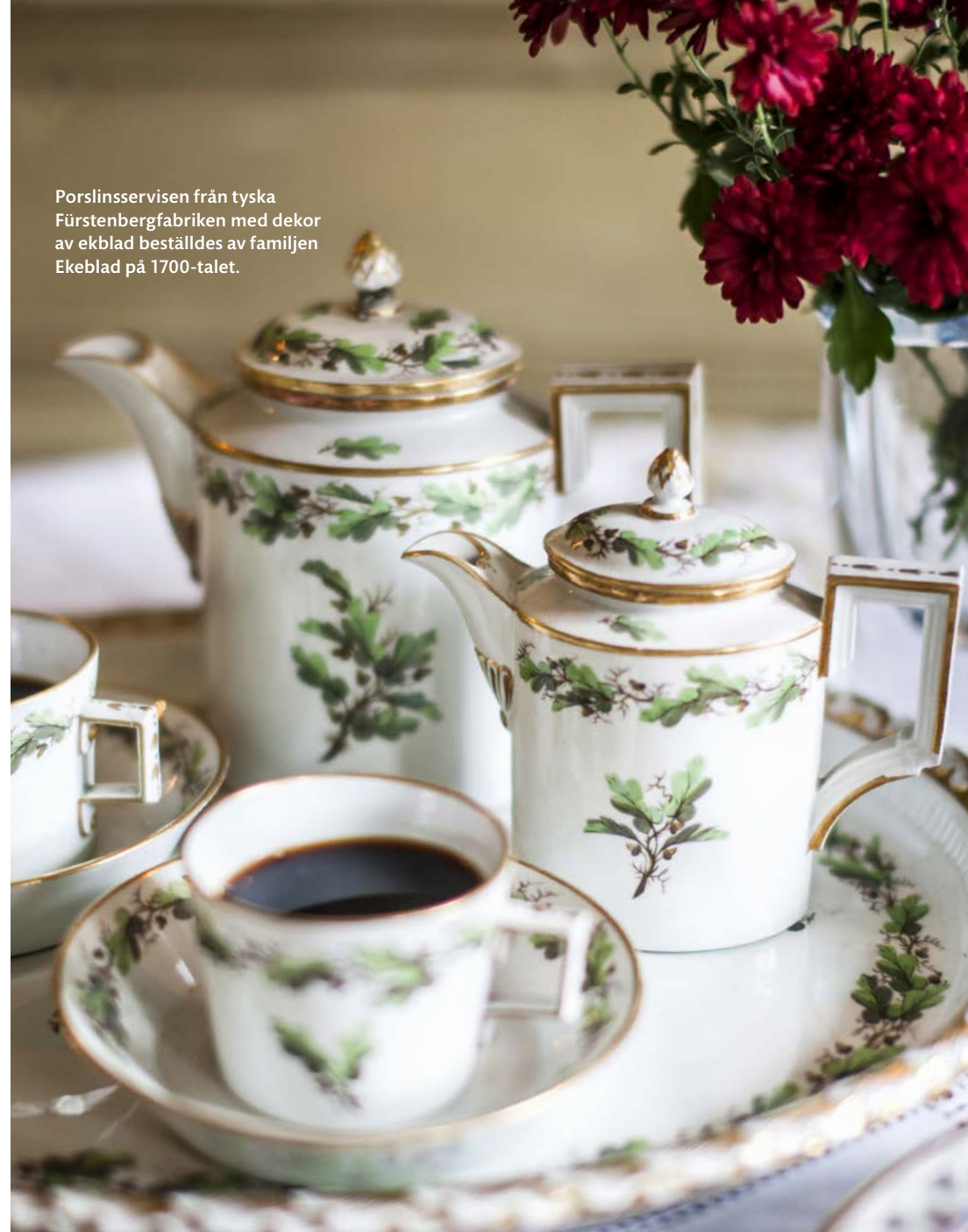
Porslinsservisen från tyska Fürstenbergfabriken med dekor av ekblad beställdes av familjen Ekeblad på 1700-talet.