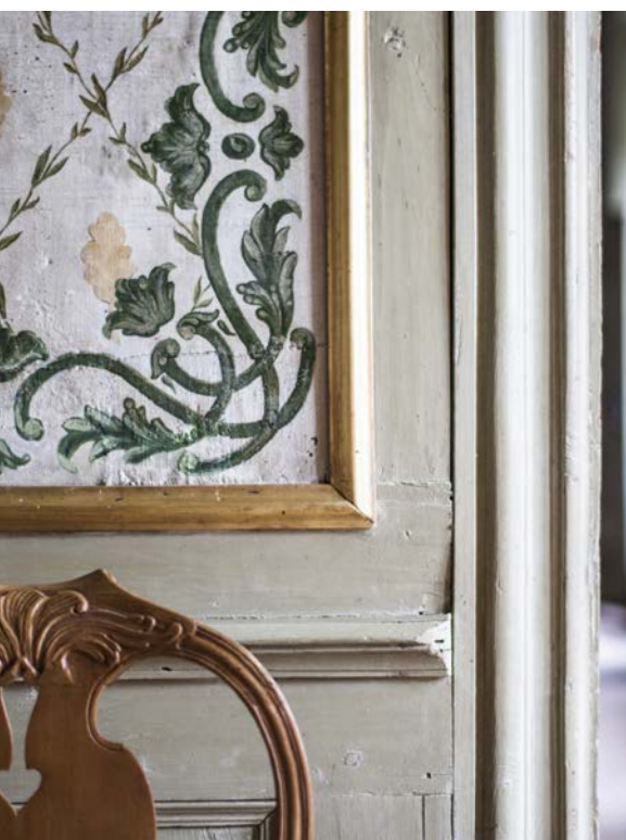
Detalj av de handmålade 1700-talstapeterna.

skapade de en elegant rosaputsad byggnad i två våningar med säteritak. Fyra kvadratiska flygelbyggnader med tälttak kompletterade gårdsrummet.