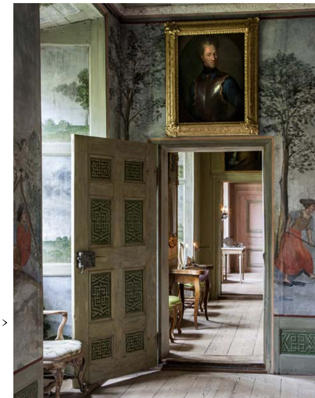
Övervåningens sällsamsrum ligger i fil.